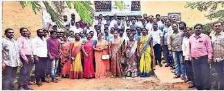
పాల్గొన్న ఎస్ఎంఎల్ ప్రభుత్వ డిగ్రీ కళాశాల పూర్వ విద్యార్థులు

నాది 2002 బ్యాచ్ డిగ్రీ వీధి పూర్తి చేశాను. కళాశాలలో నేను చదివే లోజులో తక్కువ వసతులు ఉండేవి. అయినా కూడా అధ్యాపక బృందం మాకు అన్ని విధాలుగా ప్రోత్సహిస్తూ పాఠాలు గుర్తుండే విధంగా బోధించారు. చరిత్ర పాఠ్యాంశాలు పోటీ పరీక్షలకు ఎంతగానో ఉపయోగపడ్డాయి. మా అధ్యాపకుల కృషి వలననే నేడు ఈ స్థాయిలో రాజీందాసు, సీపిగా అనంతపురంలో విదలు నిర్వహిస్తున్నా.